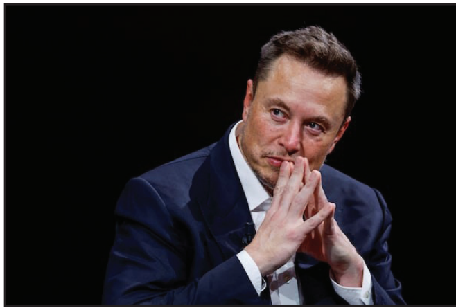
ਫੋਰਬਜ਼ ਅਨੁਸਾਰ, ਨਾਲ ਦੋਵਾਂ ਕੰਪਨੀਆਂ ਦਾ ਸਪੇਸਐੱਕਸ ਅਤੇ X AI ਦੇ ਰਲੇਵੇਂ ਸੰਯੁਕਤ ਮੁੱਲ ਲਗਭਗ 1.25

ਨਿਊ ਯੋਰਕ: ਟੈੱਸਲਾ ਦੇ ਮਾਲਕ ਅਤੇ ਵਿਸ਼ਵ-ਪ੍ਰਸਿੱਧ ਉਦਯੋਗਪਤੀ ਈਲੋਨ ਮਸਕ ਨੇ ਇੱਕ ਵਾਰ ਫਿਰ ਇਤਿਹਾਸ ਰਚਿਆ ਹੈ। ਏਅਰਸਪੇਸ ਕੰਪਨੀ ਸਪੇਸਐੱਕਸ ਦੁਆਰਾ ਆਪਣੀ ਆਰਟੀਫੀਸ਼ੀਅਲ ਇੰਟੇਲੀਜੈਂਸ ਅਤੇ ਸੋਸ਼ਲ ਮੀਡੀਆ ਫਰਮ X AI ਨੂੰ ਪ੍ਰਾਪਤ ਕਰਨ ਤੋਂ ਬਾਅਦ ਮਸਕ ਦੀ ਦੌਲਤ 'ਚ ਭਾਰੀ ਵਾਧਾ ਹੋਇਆ ਹੈ। ਉਸ ਦੀ ਕੁੱਲ ਜਾਇਦਾਦ ਹੁਣ $800 ਬਿਲੀਅਨ ਨੂੰ ਪਾਰ ਕਰ ਗਈ ਹੈ ਜਿਸ ਨਾਲ ਉਹ ਦੁਨੀਆਂ ਦਾ ਸਭ ਤੋਂ ਅਮੀਰ ਵਿਅਕਤੀ ਬਣ ਗਿਆ ਹੈ।